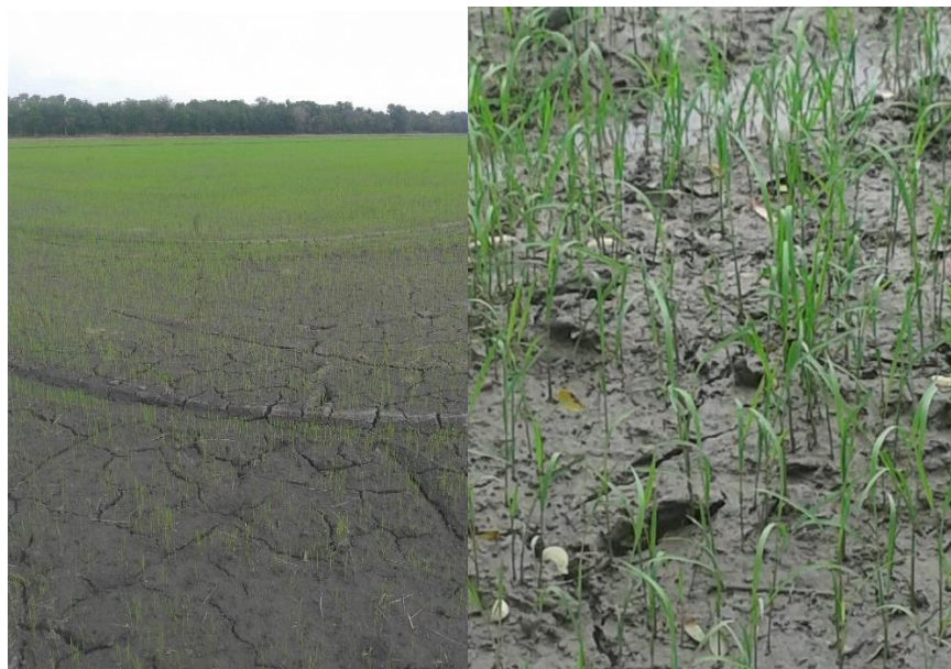
ระยะกล้า

● การเพาะกล้าในดินแห้ง ในกรณีที่ขาวนาไม่มีน้ำเพียงพอสำหรับการตากกล้าในดินเปียก ขาวนาอาจทำการตากกล้าบนที่ดอนซึ่งไม่มีน้ำขัง โดยเอาเมล็ดพันธุ์ที่สมบูรณ์ซึ่งยังไม่ได้เพาะให้งอกไปโรยไว้ในแถวที่เปิดเป็นร่องเล็ก ๆ ขนาดยาวประมาณ 1 เมตร จำนวนหลายแถว แล้วกลบดินเพื่อป้องกันนกและหนู หลังจากนั้นรดน้ำด้วยบัวรดน้ำวันละ 2 - 3 ครั้ง เมล็ดจะงอกขึ้นมาเป็นต้นกล้าเหมือนกับการตากกล้าในดินเปียก ปกติใช้เมล็ดพันธุ์จำนวน 7 - 10 กรัม/แถวที่มีความยาว 1 เมตรและแถวห่างกันประมาณ 10 เซนติเมตร หลังจากโรยเมล็ดและกลบดินแล้ว ควรหว่านปุ๋ยพวกที่ให้ธาตุไนโตรเจนและฟอสฟอรัสในอัตราต่ำลงไปด้วย