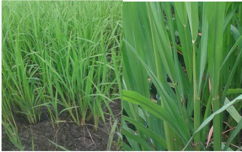
ระยะแตกกอ