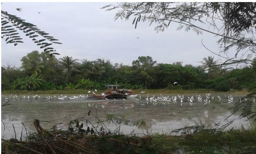
การเตรียมแปลงนาข้าว

(3) การเตรียมดินสำหรับทำนาด้วยวิธีหว่าน เป็นการเตรียมดินขณะที่ไม่มีน้ำขังในแปลงนา ในช่วงต้นฤดูฝนขณะที่ดินมีความชื้นแล้วจึงไถตะลิกประมาณ 15 - 20 เซนติเมตร พลิกกลับดินทิ้งไว้เป็นเวลา 1 – 2 สัปดาห์ เพื่อให้ดินชั้นล่างได้รับก๊าซออกซิเจนจากอากาศและเป็นการกำจัดวัชพืช โรคพืชและตัวอ่อน ของแมลง แล้วไถแปรอีก 1 – 2 ครั้ง เพื่อกำจัดวัชพืชและย่อยสลายดิน หว่านเมล็ดข้าวแห้งหรือยอดเมล็ดเสร็จแล้ว คราดกลบ