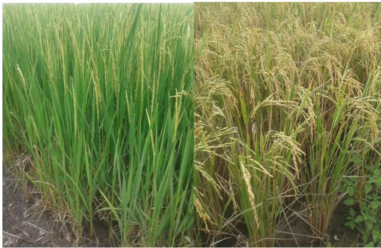
ระยะออกดอก

ระยะที่ 2 การเจริญเติบโตทางสีบพันธุ์ เริ่มจากเริ่มสร้างดอก ตั้งท้องออกดอก จนถึงการผสมพันธุ์ ระยะนี้จะใช้เวลาเท่าใดขึ้นอยู่กับชนิดพันธุ์ข้าว เช่น ข้าวหอมมะลิ 105 ใช้ระยะเวลา 20 - 30 วัน การดูแลรักษาในระยะนี้ ถ้าบำรุงดินให้มีความอุดมสมบูรณ์แล้ว ให้ออยุ่ระดับน้ำไม่ให้สูงเกิน และระวังโรคแมลง ถ้ามีการฉีดพ่นฮอร์โมนน้ำด้วยจะช่วยให้ข้าวออกรวงโต