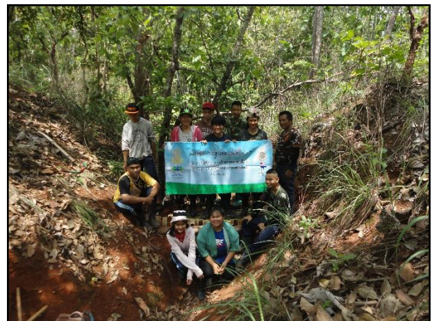
รูปกิจกรรม ณ เดือน มิถุนายน 2560