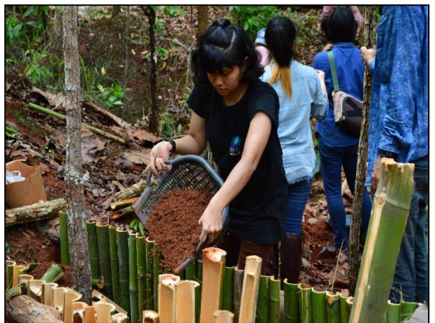
รูปกิจกรรม ณ เดือน มิถุนายน 2560