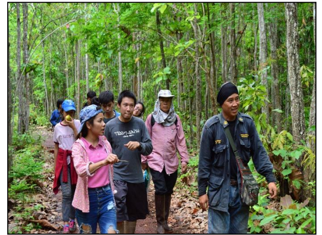
รูปกิจกรรม ณ เดือน มิถุนายน 2560