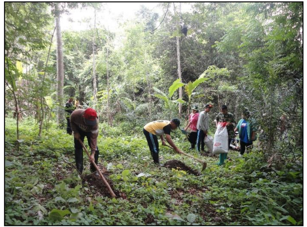
รูปกิจกรรม ณ เดือน มิถุนายน 2560