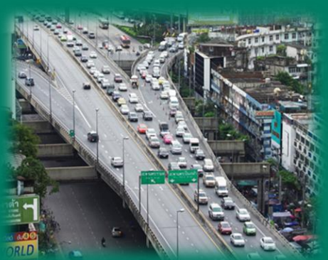
แยกอรุณอมรินทร์