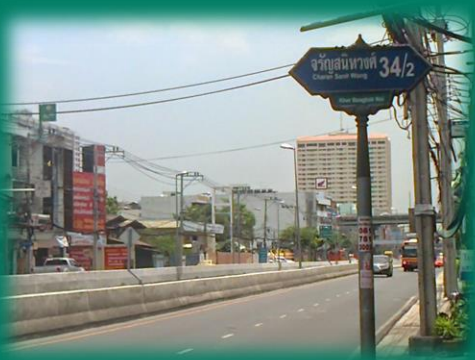
ถนนจรัญสนิทวงศ์