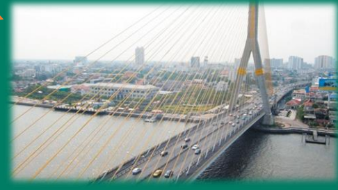
สะพานพระราม 8