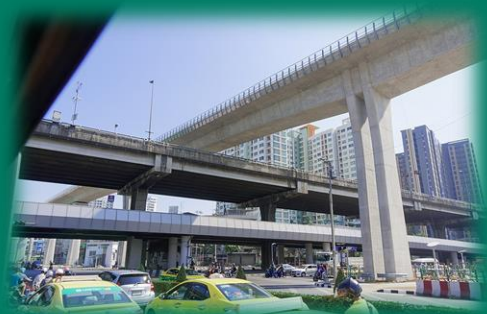
สี่แยกบรมราชชนนี