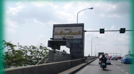
สะพานสมเด็จพระปิ่นเกล้า