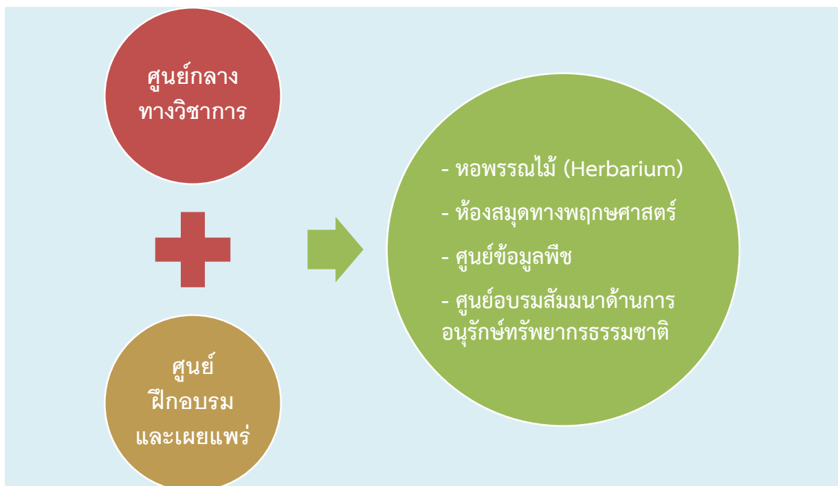
ยุทธศาสตร์ที่ ๓ ศูนย์กลางทางวิชาการ และศูนย์ฝึกอบรมและเผยแพร่

คืบคว้า วิจัยทางพฤกษศาสตร์ให้กับนักวิชาการ นักวิจัย ผู้เชี่ยวชาญด้านต่างๆ ที่เกี่ยวข้องเพื่อค้นคว้าและพัฒนาองค์ความรู้ใหม่ๆ ผ่านบริการและการอำนวยความสะดวกต่างๆ ได้แก่ หอพรรณไม้ ห้องสมุดทางพฤกษศาสตร์ ศูนย์ข้อมูลพืช เป็นต้น ตลอดจนเป็น ศูนย์ฝึกอบรมและเผยแพร่ องค์ความรู้เกี่ยวกับการพัฒนาพื้นที่กิจกรรมเหมืองแร่เดิมสู่แหล่งเรียนรู้ทางธรรมชาติให้กับนักเรียน นักศึกษา และผู้สนใจที่เข้ามาเยี่ยมชม ได้แก่ การจัดการป่าไม้ภายหลังจากการทำเหมืองแร่สังกะสี การใช้หญ้าแฝกเพื่อปรับปรุงและเพิ่มความอุดมสมบูรณ์ของดิน การเฝ้าระวังและการใช้ประโยชน์พื้นที่ที่มีสารปนเปื้อนอย่างเหมาะสม เป็นต้น