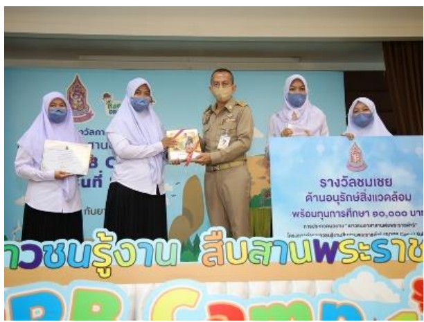
ประธานในพิธีมอบรางวัลต่าง ๆ ให้แก่ทีมเยาวชนทั้ง 10 ทีม