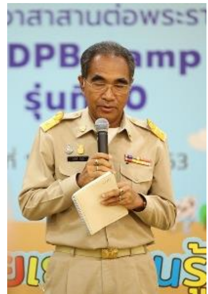
ตัวแทนเยาวชนกล่าวขอบคุณ/ความรู้สึกที่ได้ส่งโครงการของตนเข้าร่วม เข้าร่วมการประกวด