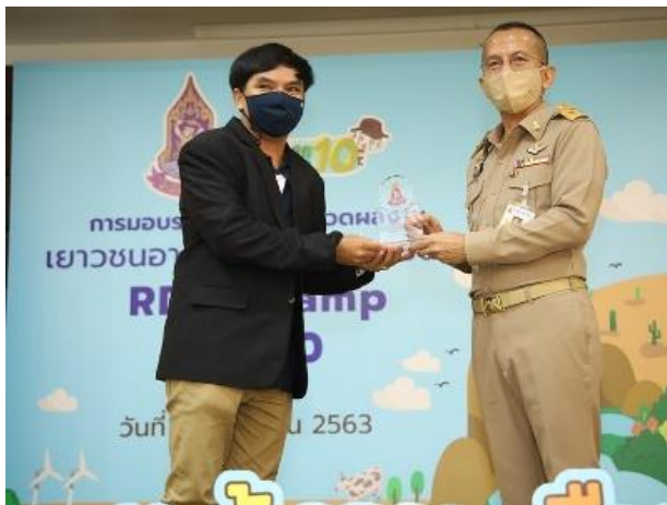
มอบรางวัลเชิดชูเกียรติแก่อาจารย์ที่ปรึกษาทีมเยาวชน จาก มหาวิทยาลัยราชภัฏรำไพพรรณี จังหวัดจันทบุรี