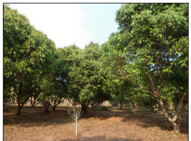
รูปกิจกรรม ณ เดือน เมษายน 2560