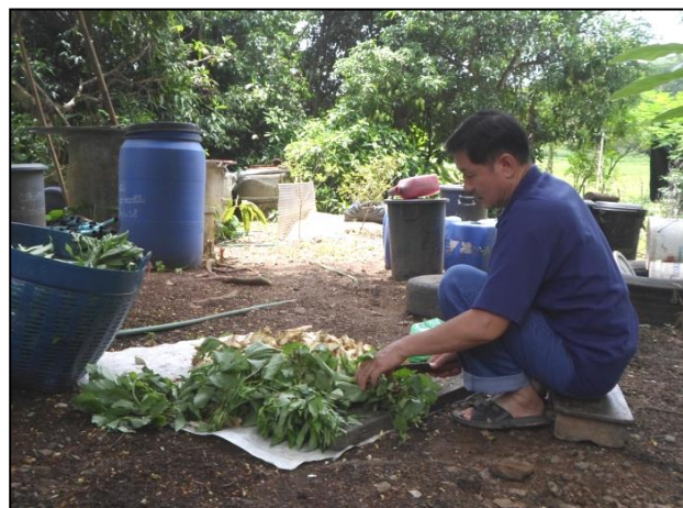
รูปกิจกรรมใน ปี พ.ศ. 2558 - 2559