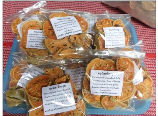
รูปกิจกรรมใน ปี พ.ศ. 2558 - 2559