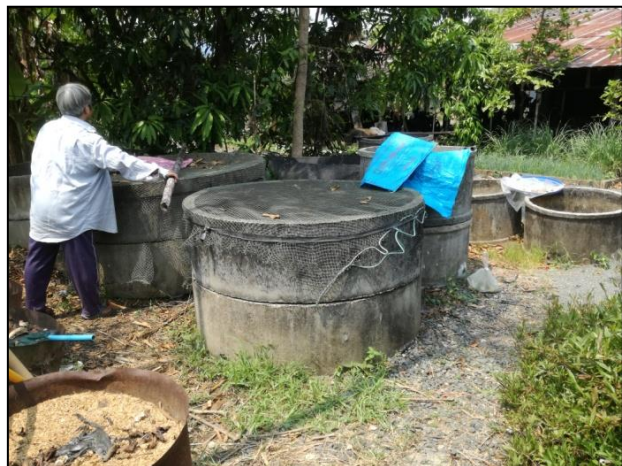
รูปกิจกรรม ณ เดือน พฤษภาคม 2560