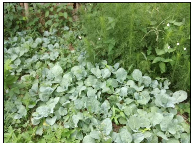
รูปกิจกรรม ณ เดือน มิถุนายน 2561