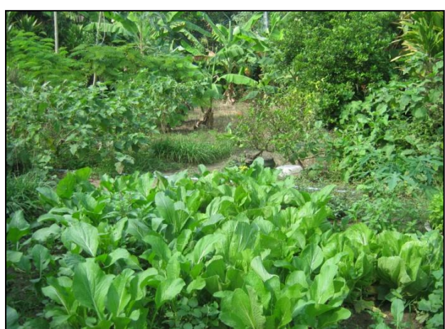
รูปกิจกรรมใน ปี พ.ศ. 2558 - 2559