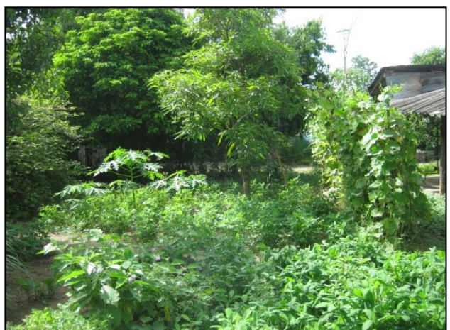
รูปกิจกรรมใน ปี พ.ศ. 2558 - 2559