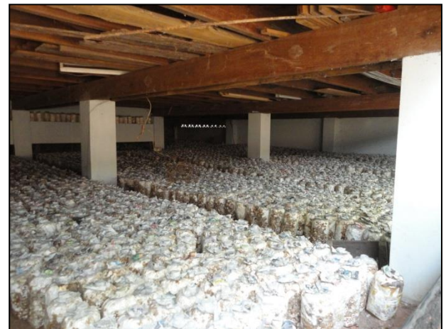
รูปกิจกรรมใน ปี พ.ศ 2558 - 2559