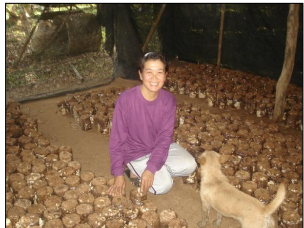
รูปกิจกรรมใน ปี พ.ศ 2558 - 2559