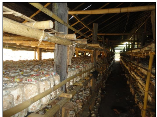
รูปกิจกรรม ณ เดือนพฤษภาคม 2560