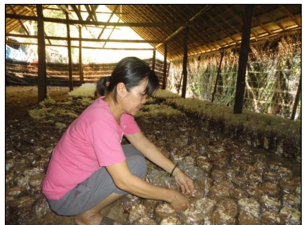
รูปกิจกรรม ณ เดือนพฤษภาคม 2560