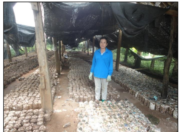
รูปกิจกรรมใน ปี พ.ศ 2558 - 2559