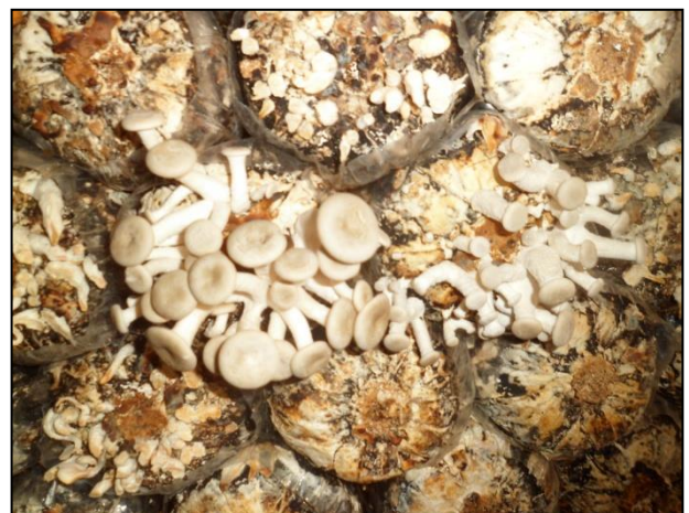
รูปกิจกรรมใน ปี พ.ศ 2558 - 2559