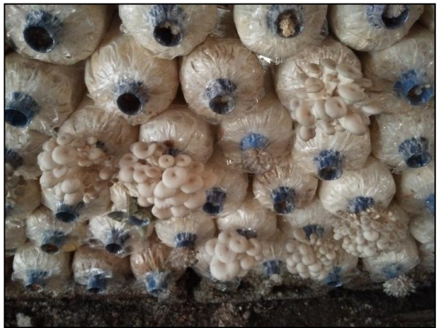
รูปกิจกรรม ณ เดือน มีนาคม 2561