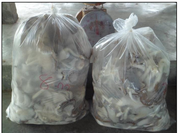
รูปกิจกรรม ณ เดือน กันยายน 2560