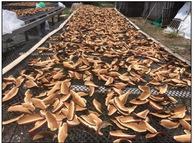
รูปกิจกรรม ณ เดือน สิงหาคม 2561