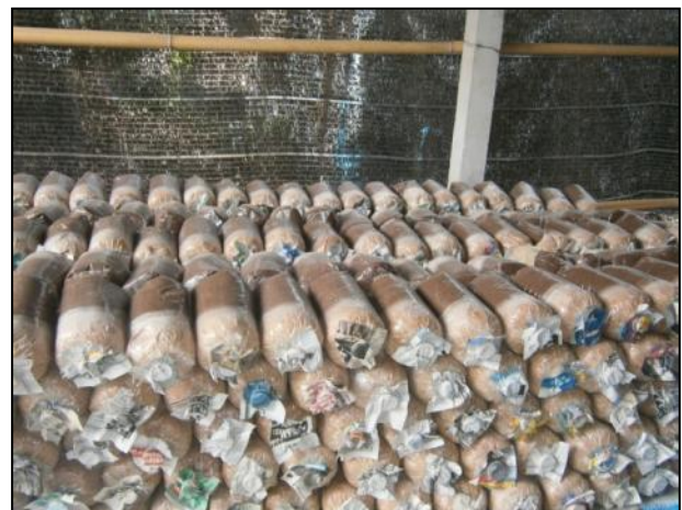
รูปกิจกรรมใน ปี พ.ศ 2558 - 2559