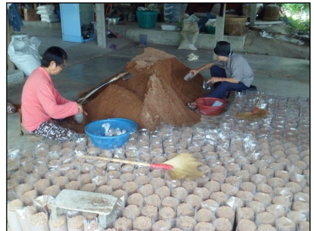
รูปกิจกรรมใน ปี พ.ศ 2558 - 2559