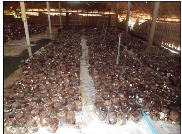
รูปกิจกรรมใน ปี พ.ศ 2558 - 2559