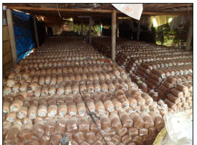
รูปกิจกรรม ณ เดือน เมษายน 2560