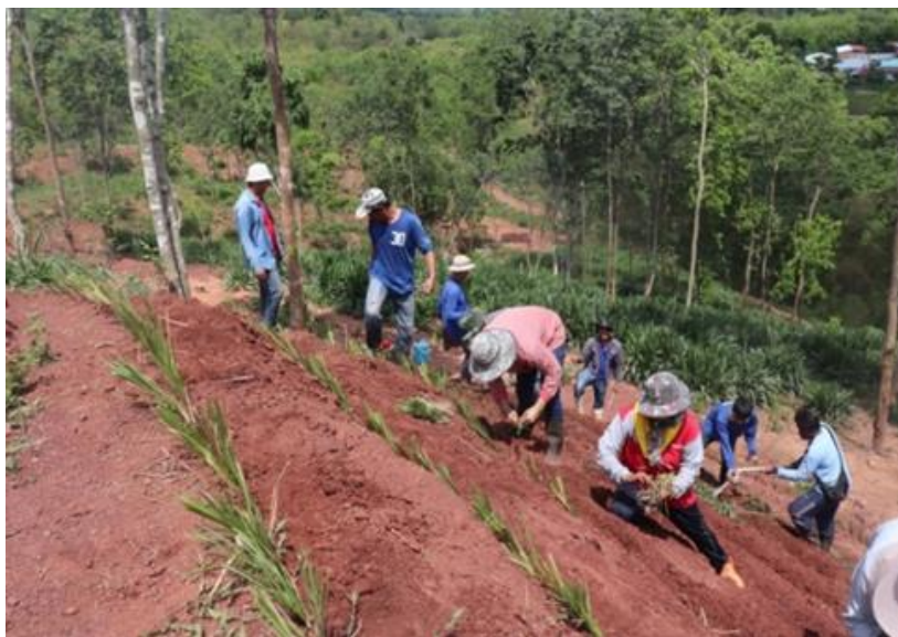
กิจกรรมปลูกหญ้าแฝก จำนวน 50,000 กล้า โครงการศูนย์พัฒนาพันธุ์สัตว์พระราชทานด้านชาย จังหวัดเลย