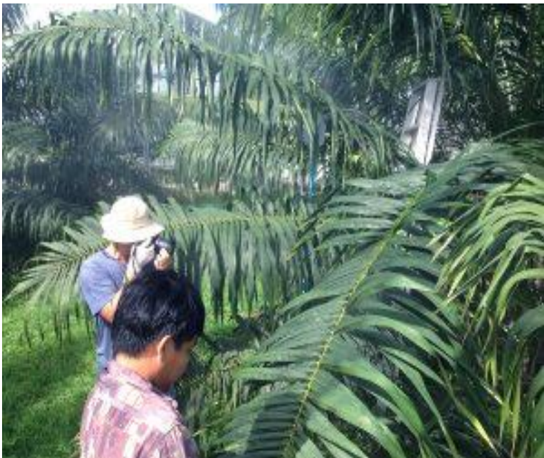
โครงการวิจัยเปรียบเทียบการเจริญเติบโตปาล์มน้ำมันทนแล้ง โครงการศูนย์รวบรวมพันธุ์ปาล์มน้ำมัน จังหวัดตรัง

โครงการทดสอบแหล่งพันธุ์และการทดลอง ปลูกเสมีตขาว โครงการศึกษา วิจัย ทดลอง การปลูกและใช้ประโยชน์ไม้เสมีตแบบครบ วงจร จังหวัดนครศรีธรรมราช