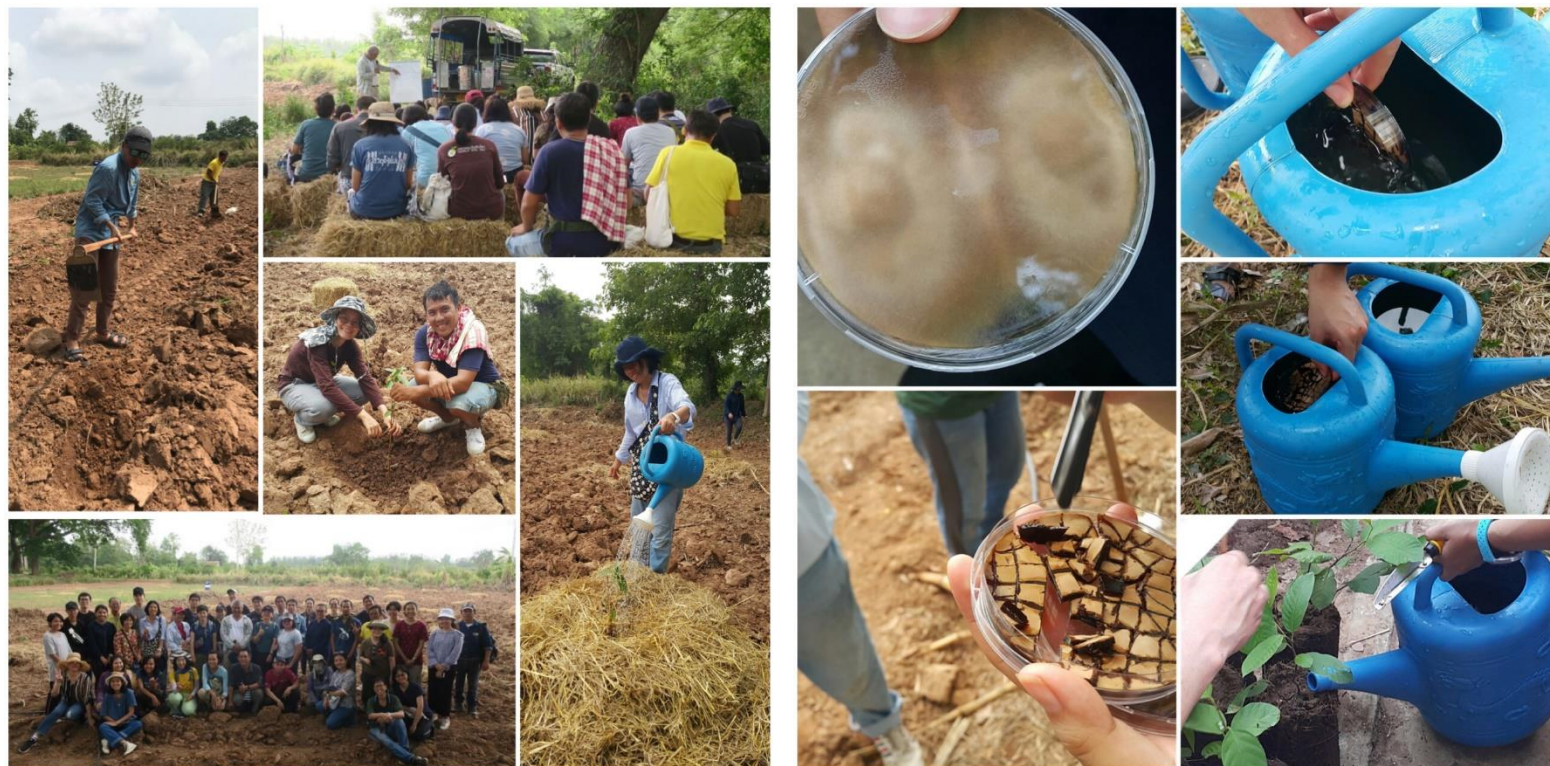
โครงการอบรมเชิงปฏิบัติการ “ฟื้นฟูป่าฟื้นถิ่นด้วยราเอกโตไมคอร์ไรซา” ร่วมกับ องค์กร The Mushroom Initiative (TMI) เขตบริหารพิเศษฮ่องกงแห่งสาธารณรัฐ ประชาชนจีน และมูลนิธิฟื้นฟูป่าฟื้นถิ่นประเทศไทย โครงการพัฒนาที่ดินมูลนิธิชัยพัฒนาบ้านเหมือดแอ่ จังหวัดขอนแก่น