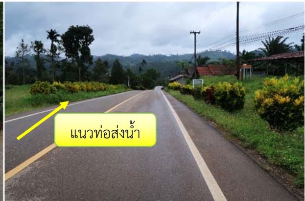
แนวท่อส่งน้ำวางขนานไปตามแนวถนน