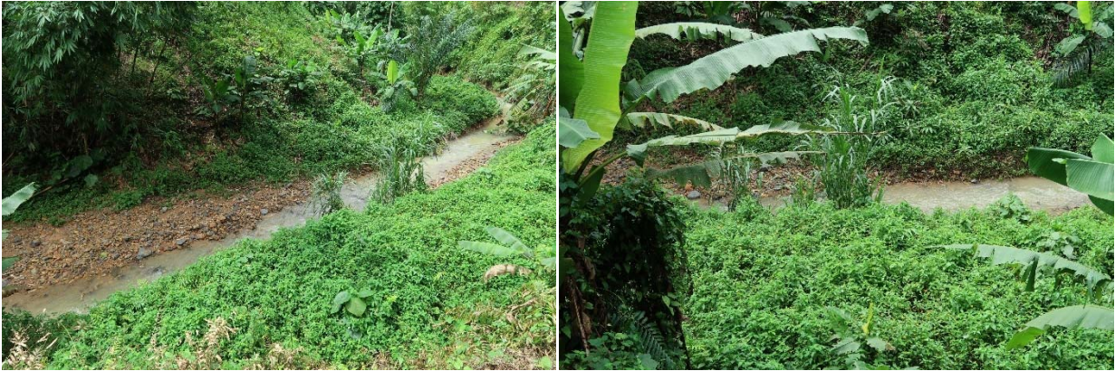
สภาพพื้นที่ที่จะดำเนินการก่อสร้างอาคารอัดน้ำ