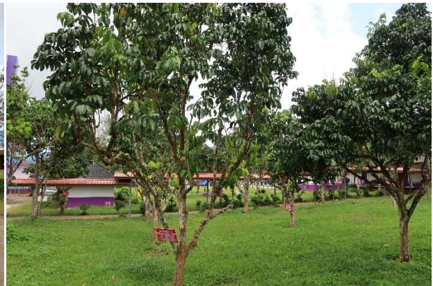
บ้านเรือนราษฎรรวมทั้งพื้นที่โรงเรียนบ้านโนนงที่ได้รับประโยชน์จากโครงการฯ