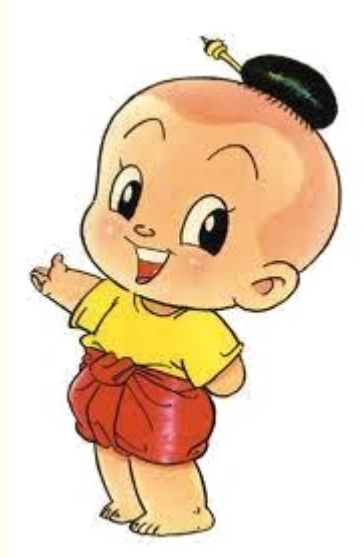
โครงการสาธิตทฤษฎีใหม่อันเนื่องมาจากพระราชดำริ อ.ปักธงชัย จ.นครราชสีมา