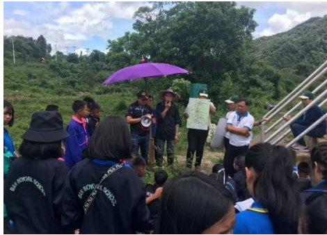
ถ่ายทอดองค์ความรู้งานชลประทาน ให้แก่เยาวชน