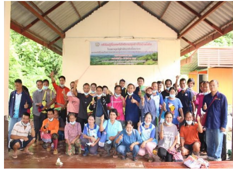
กิจกรรมส่งเสริมการปลูกข้าวและตัดพันธุ์ข้าว