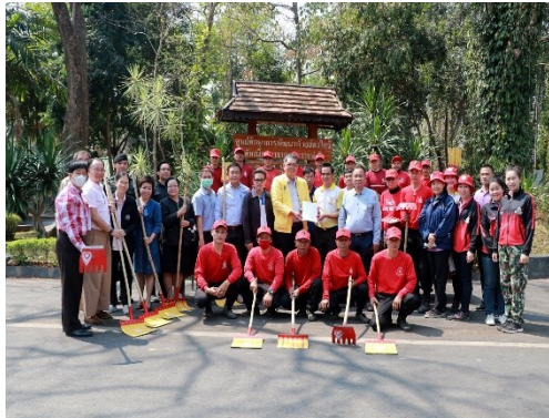
โครงการฝึกอบรมพัฒนาบุคลากรเพื่อเพิ่มประสิทธิภาพ ในการทำงานควบคุมและป้องกันไฟฟ้า