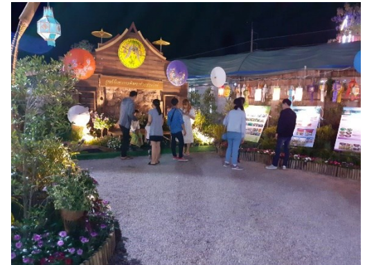
นิทรรศการในงานฤดูหนาว และงาน OTOP ของดีเมืองเชียงใหม่