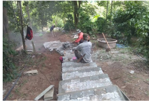
กิจกรรมปรับปรุงภูมิทัศน์ในพื้นที่โครงการ