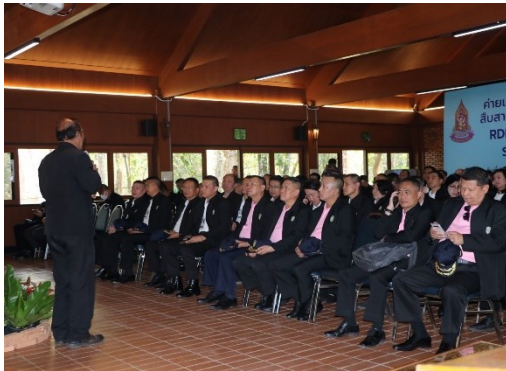
งานด้านการประชาสัมพันธ์และเผยแพร่

(1) ศูนย์ศึกษาการพัฒนาห้วยฮ่องไคร้อันเนื่องมาจากพระราชดำริ จังหวัดเชียงใหม่