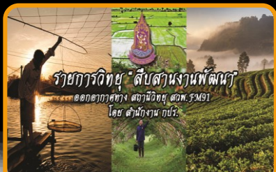
รายการวิทยุ