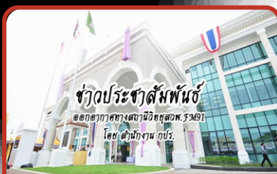
ข่าวประชาสัมพันธ์