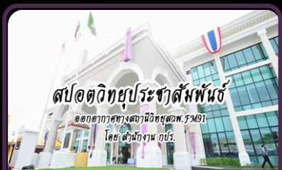
สปอตประชาสัมพันธ์