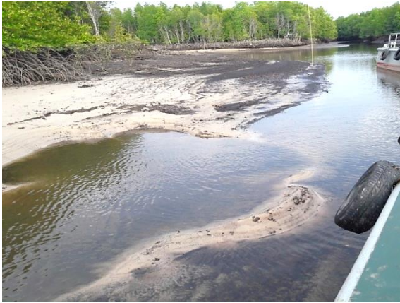
แนวร่องน้ำที่จะดำเนินการขุดลอก