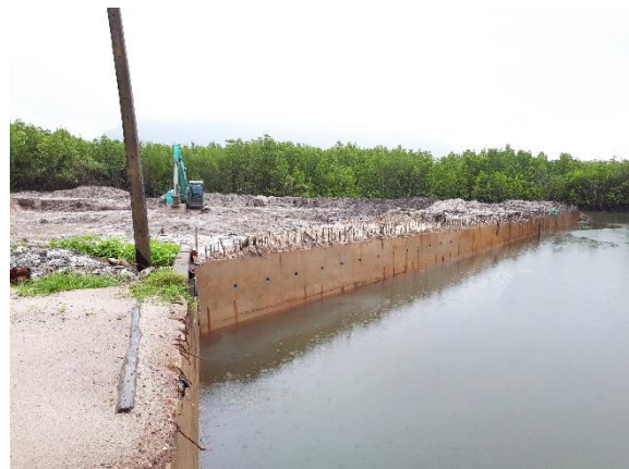
งานก่อสร้างเขื่อนป้องกันตลิ่งพังหน้าท่าเทียบเรือมูลนิธิชัยพัฒนา - กาชาดไทย (บ้านทุ่งรัก)