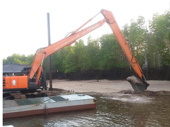
งานขุดลอกร่องน้ำ