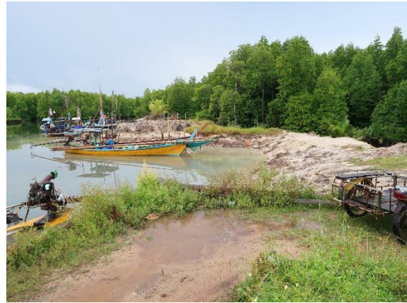
บริเวณที่จะดำเนินการก่อสร้างกำแพงกันดิน