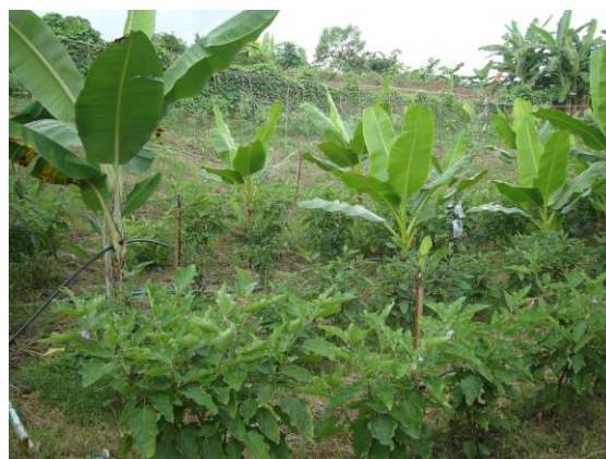
แปลงเกษตร