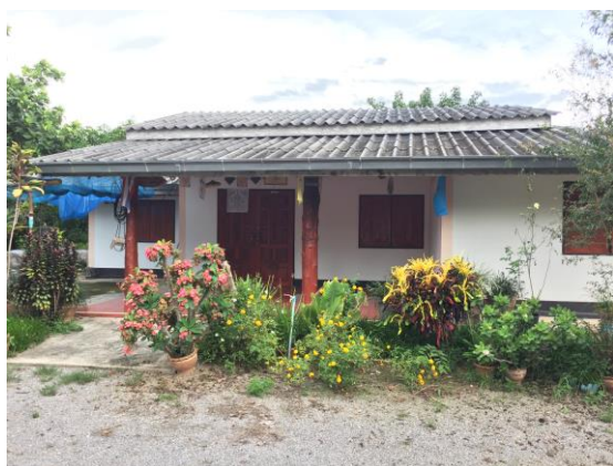
ที่อยู่อาศัย

ต่อมาเมื่อมีโครงการอ่างเก็บน้ำบ้านพุกรุดอันเนื่องมาจากพระราชดำริ ทำให้สามารถทำการเกษตรได้ตลอดทั้งปี โดยทำเกษตรแบบผสมผสาน ปลูกไม้ผล ไม้ยืนต้น และผักสวนครัว เช่น ทุเรียน มังคุด เงาะ กล้วย เป็นต้น ปัจจุบัน มีชีวิตความเป็นอยู่ที่ดีขึ้น มีรายได้เพิ่มมากขึ้น และไม่มีหนี้สิน