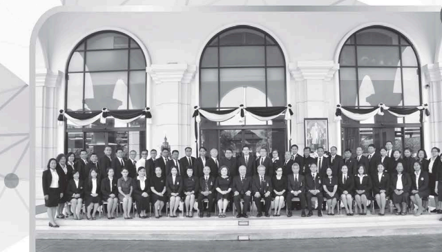
สำนักงาน กปร. จัดฝึกอบรมหลักสูตรพัฒนาองค์ความรู้และเสริมสร้างเครือข่ายขับเคลื่อนการพัฒนาตามแนวพระราชดำริและปรัชญาของเศรษฐกิจพอเพียง (พพร.) รุ่นที่ ๖

เมื่อวันจันทร์ที่ ๒๙ ถึงวันพุธที่ ๓๑ พฤษภาคม ๒๕๖๐ สมเด็จพระเทพรัตนราชสุดาฯ สยามบรมราชกุมารี เสด็จพระราชดำเนินไปทรงติดตามผลการดำเนินงานโครงการอันเนื่องมาจากพระราชดำริ ในพื้นที่จังหวัดอุดรธานี จำนวน ๓ แห่ง ได้แก่ โรงเรียนตำรวจตระเวนชายแดนบ้านเมืองทอง, โรงเรียนตำรวจตระเวนชายแดนบ้านห้วยเวียงงาม และโรงเรียนตำรวจตระเวนชายแดนบ้านนาหมูก อำเภอนาแก ในพื้นที่จังหวัดมุกดาหาร จำนวน ๑ แห่ง ได้แก่ ศูนย์การเรียนรู้ตำรวจตระเวนชายแดนชุมชนได้ม พระบารมี อำเภอคำชะอี และในพื้นที่จังหวัดนครพนม จำนวน ๑ แห่ง ได้แก่ โรงเรียนตำรวจตระเวนชายแดนบ้านนาสามัคคี อำเภอท่าบ่อ