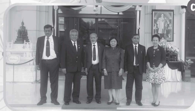
รองเลขาธิการ กปร. ให้การต้อนรับและบรรยายให้กับคณะรัฐมนตรีว่าการกระทรวงประมงและปศุสัตว์ แห่งสาธารณรัฐประชาชนบังคลาเทศ ณ สำนักงาน กปร.

เมื่อวันพฤหัสบดีที่ ๑๑ พฤษภาคม ๒๕๖๐ สมเด็จพระเทพรัตนราชสุดาฯ สยามบรมราชกุมารี เสด็จพระราชดำเนินไปทรงติดตาม ผลการดำเนินงานโครงการอันเนื่องมาจากพระราชดำริ ณ โรงเรียนตำรวจตระเวนชายแดนบ้านเขาสารภี อำเภออรัญประเทศ จังหวัดสระแก้ว