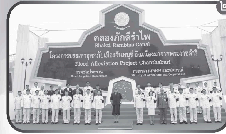
สมเด็จพระเทพรัตนราชสุดาฯ สยามบรมราชกุมารี เสด็จพระราชดำเนินไปทรงปฏิบัติพระราชกรณียกิจ ในพื้นที่จังหวัดจันทบุรี