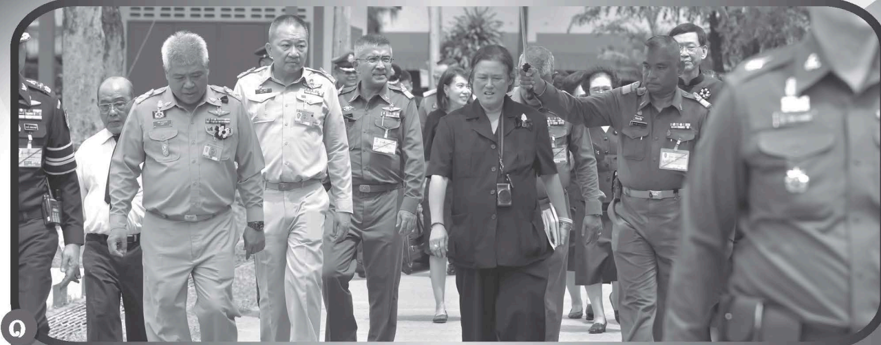
สมเด็จพระเทพรัตนราชสุดาฯ สยามบรมราชกุมารี เสด็จพระราชดำเนินไปทรงปฏิบัติพระราชกรณียกิจ ในพื้นที่จังหวัดบึงกาฬ จังหวัดบุรีรัมย์ และจังหวัดสุรินทร์

เมื่อวันอังคารที่ ๒๓ ถึงวันพฤหัสบดีที่ ๒๕ พฤษภาคม ๒๕๖๐ สมเด็จพระเทพรัตนราชสุดาฯ สยามบรมราชกุมารี เสด็จพระราชดำเนินไปทรงติดตามผลการดำเนินงานโครงการอันเนื่องมาจากพระราชดำริ ในพื้นที่จังหวัดบึงกาฬ จำนวน ๑ แห่ง ได้แก่ โรงเรียนชุมชนบ้านขาง อำเภอเซกา ในพื้นที่จังหวัดบุรีรัมย์ จำนวน ๓ แห่ง ได้แก่ กลุ่มผู้ผลิตพันธุ์ข้าวหอมมะลิ ๑๐๕ พระราชทาน “เพื่อนช่วยเพื่อน” หองจรเข้เผือก โครงการขุดลอกอ่างเก็บน้ำ หุ้งใหญ่ อำเภอลำปลายมาศ และมณฑลทหารบกที่ ๒๖ ค่ายสมเด็จพระนเรศวรมหาราช อำเภอเมืองบุรีรัมย์ และในพื้นที่จังหวัดสุรินทร์ จำนวน ๖ แห่ง ได้แก่ ศาลากลางจังหวัดสุรินทร์ อำเภอเมือง, โครงการ “ทางนี้มีผล ผู้คนรักกัน”, โครงการผลิตกึ่งพันธุ์ไม่ผลพระราชทานโดยชุมชน “เพื่อนช่วยเพื่อน” อำเภอศีขรภูมิ, กลุ่มผู้ผลิตไก่พื้นบ้าน พระราชทาน “เพื่อนช่วยเพื่อน”, กลุ่มผลิตเมล็ดพันธุ์ข้าวหอมมะลิ ๑๐๕ พระราชทาน “เพื่อนช่วยเพื่อน” และศูนย์ พัฒนาพันธุ์พืชจักรพันธ์เพ็ญศิริ อำเภอสำโรงทาบ