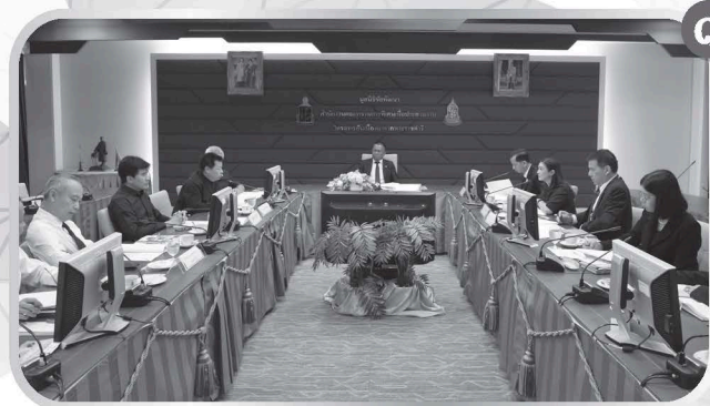
เลขาธิการ กปร. เป็นประธานการประชุมคณะอนุกรรมการโครงการอนุรักษ์แหล่งพันธุกรรมไม้สักและพัฒนาคุณภาพชีวิตราษฎรบริเวณลุ่มน้ำของลุ่มน้ำบายอันเนื่องมาจากพระราชดำริ จังหวัดแม่ฮ่องสอน