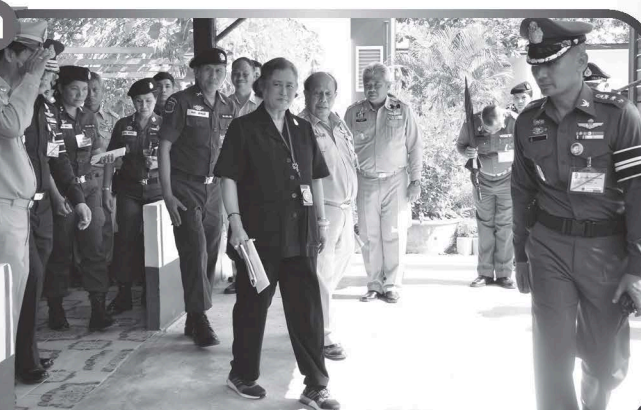
สมเด็จพระเทพรัตนราชสุดาฯ สยามบรมราชกุมารี เสด็จพระราชดำเนินไปทรงปฏิบัติพระราชกรณียกิจ ในพื้นที่จังหวัดสระแก้ว

เมื่อวันพฤหัสบดีที่ ๑๑ พฤษภาคม ๒๕๖๐ สมเด็จพระเทพรัตนราชสุดาฯ สยามบรมราชกุมารี เสด็จพระราชดำเนินไปทรงติดตาม ผลการดำเนินงานโครงการอันเนื่องมาจากพระราชดำริ ณ โรงเรียนตำรวจตระเวนชายแดนบ้านเขาสารภี อำเภออรัญประเทศ จังหวัดสระแก้ว