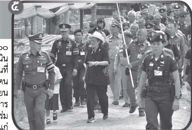
สมเด็จพระเทพรัตนราชสุดาฯ สยามบรมราชกุมารี เสด็จพระราชดำเนินไปทรงปฏิบัติพระราชกรณียกิจ ในพื้นที่จังหวัดอุดรธานี จังหวัดมุกดาหาร และจังหวัดนครพนม

เมื่อวันจันทร์ที่ ๒๙ ถึงวันพุธที่ ๓๑ พฤษภาคม ๒๕๖๐ สมเด็จพระเทพรัตนราชสุดาฯ สยามบรมราชกุมารี เสด็จพระราชดำเนินไปทรงติดตามผลการดำเนินงานโครงการอันเนื่องมาจากพระราชดำริ ในพื้นที่จังหวัดอุดรธานี จำนวน ๓ แห่ง ได้แก่ โรงเรียนตำรวจตระเวนชายแดนบ้านเมืองทอง, โรงเรียนตำรวจตระเวนชายแดนบ้านห้วยเวียงงาม และโรงเรียนตำรวจตระเวนชายแดนบ้านนาหมูก อำเภอนาแก ในพื้นที่จังหวัดมุกดาหาร จำนวน ๑ แห่ง ได้แก่ ศูนย์การเรียนรู้ตำรวจตระเวนชายแดนชุมชนได้ม พระบารมี อำเภอคำชะอี และในพื้นที่จังหวัดนครพนม จำนวน ๑ แห่ง ได้แก่ โรงเรียนตำรวจตระเวนชายแดนบ้านนาสามัคคี อำเภอท่าบ่อ