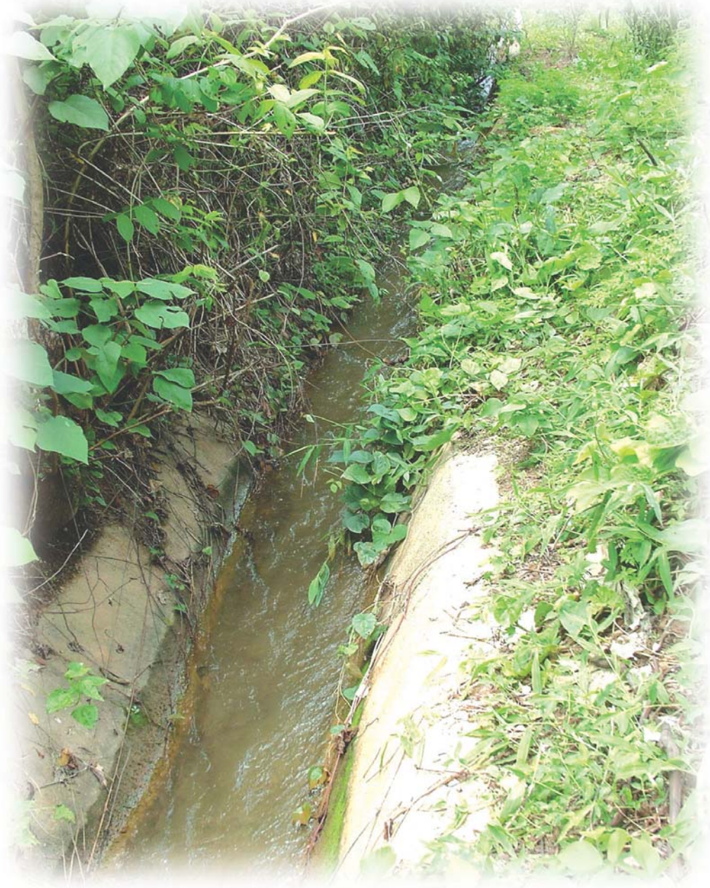
๖ ผลสำเร็จจากแนวพระราชดำริ

๖๐ ปี ครองราชย์ พระบาทสมเด็จพระวชิรเกล้าเจ้าอยู่หัว