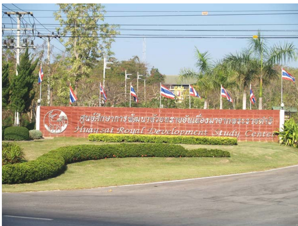
ภาพแสดงสถานที่ตั้งศูนย์ศึกษาการพัฒนาห้วยทรายอันเนื่องมาจากพระราชดำริ