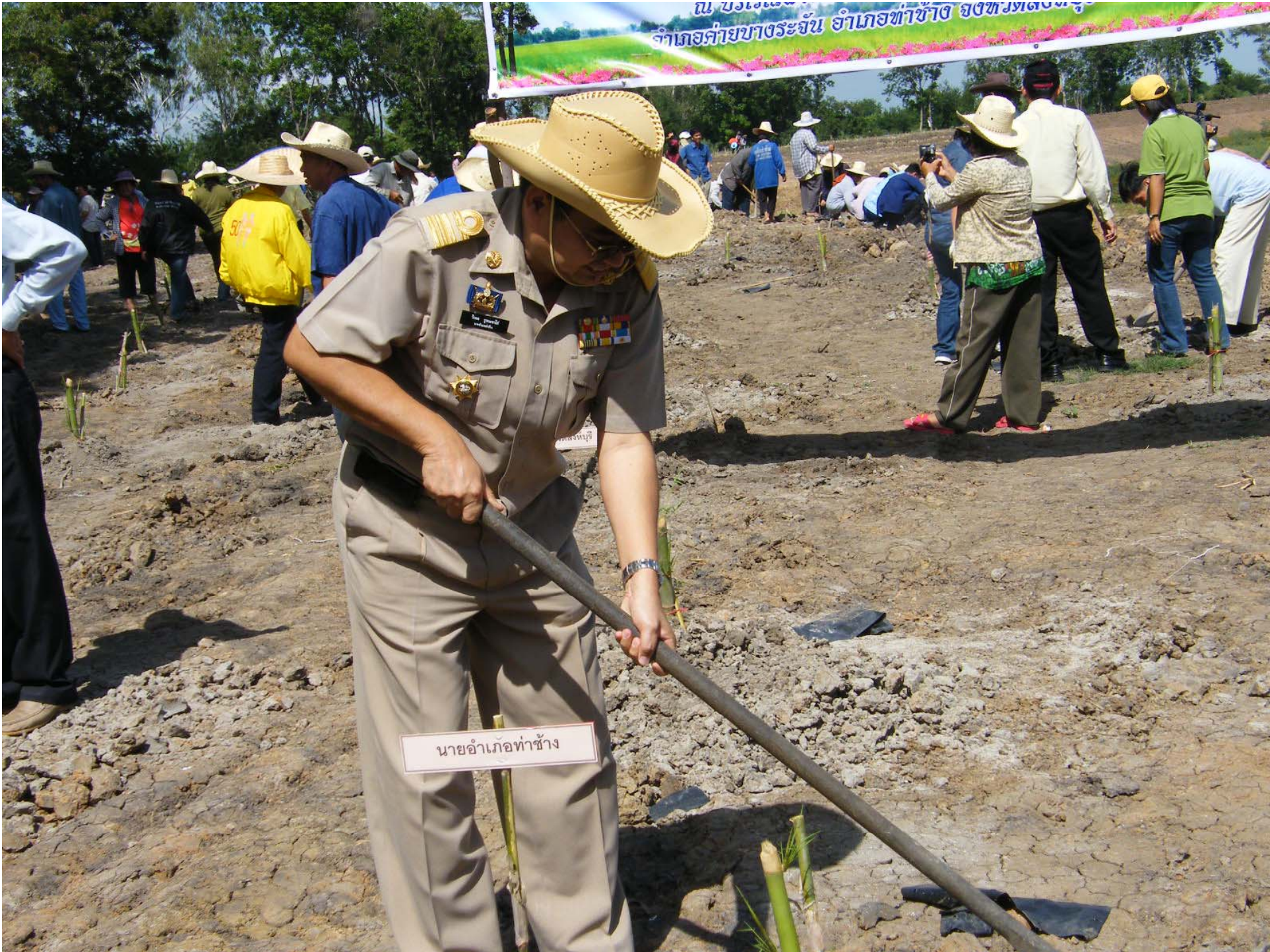
นายอำเภอคำชะอี