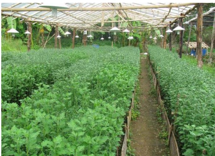
จังหวัดกาญจนบุรี