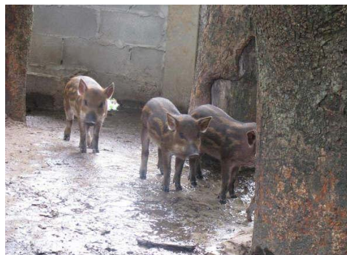
สำนักงานเกษตรและสหกรณ์จังหวัดกาญจนบุรี