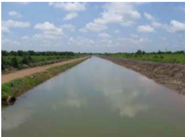
งานขุดลอกคลองระบายน้ำสายที่ 13 ความยาว 5,700 เมตร