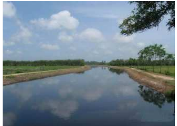
งานขุดลอกคลองระบายน้ำสายที่ 11 ความยาว 3,60 เมตร