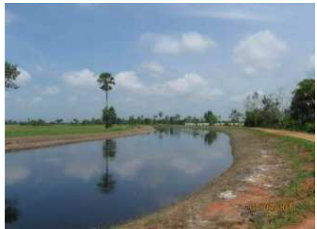
งานขุดลอกคลองระบายน้ำสายที่ 14 ความยาว 7,040 เมตร