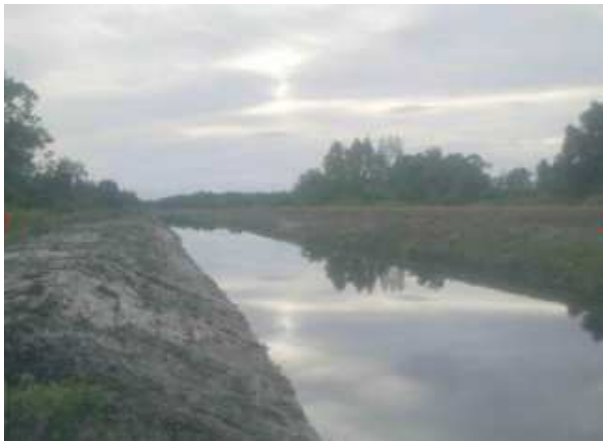
งานขุดลอกคลองระบายน้ำสายที่ 10 ความยาว 1,920 เมตร