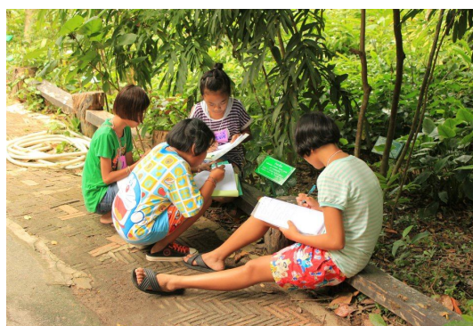
๒.๓ ส่งเสริมและพัฒนากลุ่มอาชีพ