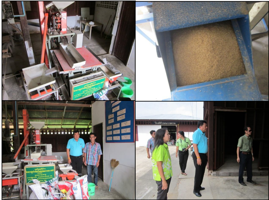
คณะทำงานโครงการฯ ตรวจสอบและติดตามผลการดำเนินงาน โรงสีข้าวพระราชทาน สหกรณ์นิคมปากน้ำ จำกัด