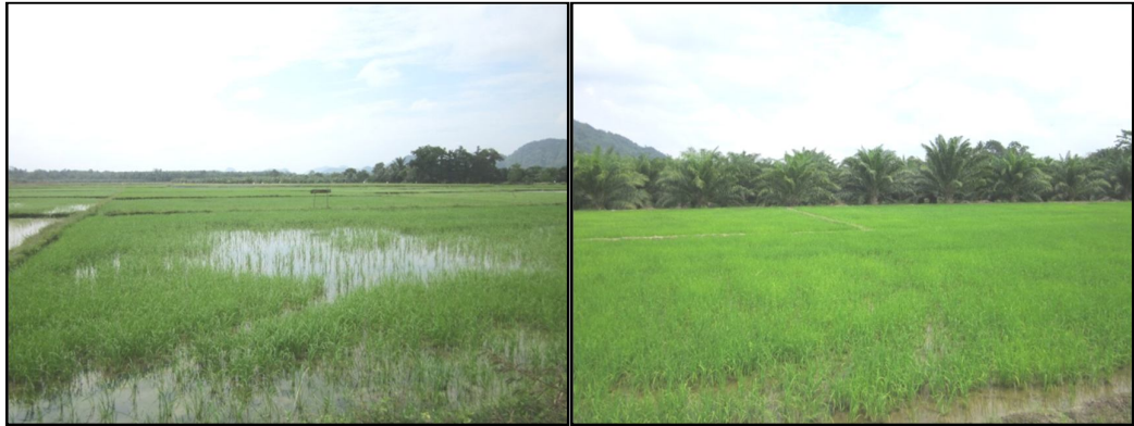
แปลงนาสมาชิกจำนวน 2 แปลง