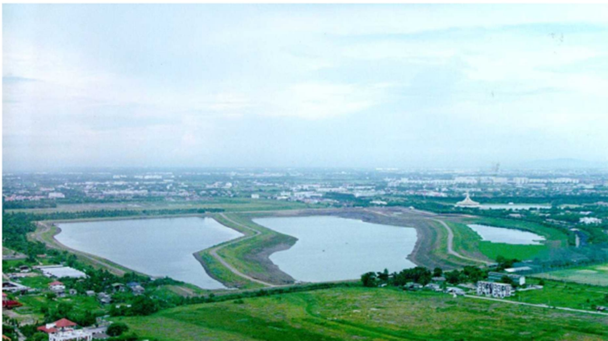
แก้มลิงบึงหนองบอน