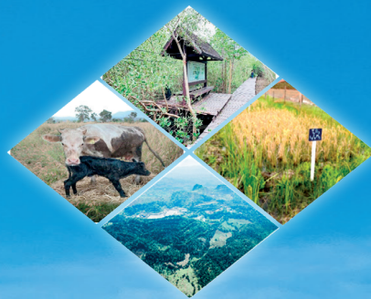
รวบรวมโดย กองติดตามประเมินผล

กองประสานงานโครงการพื้นที่ ๑ - ๔ สำนักงานคณะกรรมการพิเศษเพื่อประสานงานโครงการอันเนื่องมาจากพระราชดำริ (สำนักงาน กปร.) ได้รวบรวมข้อมูลผลการดำเนินงานโครงการอันเนื่องมาจากพระราชดำริ ประจำปีงบประมาณ ๒๕๖๓ ที่ได้รับการสนับสนุนงบประมาณจากคณะกรรมการพิเศษเพื่อประสานงานโครงการอันเนื่องมาจากพระราชดำริ (กปร.) ดำเนินการในเขตพื้นที่ทั้ง ๔ ภาค ประกอบด้วย ภาคกลาง ภาคตะวันออกเฉียงเหนือ ภาคเหนือ และภาคใต้ มีจำนวน ๑๒๖ โครงการ ใช้งบประมาณรวมทั้งสิ้น ๒,๐๗๓,๑๓๔,๓๕๖ บาท (สองพันเจ็ดสิบสามล้านหนึ่งแสนสามหมื่นสี่พันสามร้อยห้าสิบบาทถ้วน) ครอบคลุมการพัฒนาในด้านต่าง ๆ ซึ่งสามารถจำแนกตามประเภทโครงการได้ ดังนี้