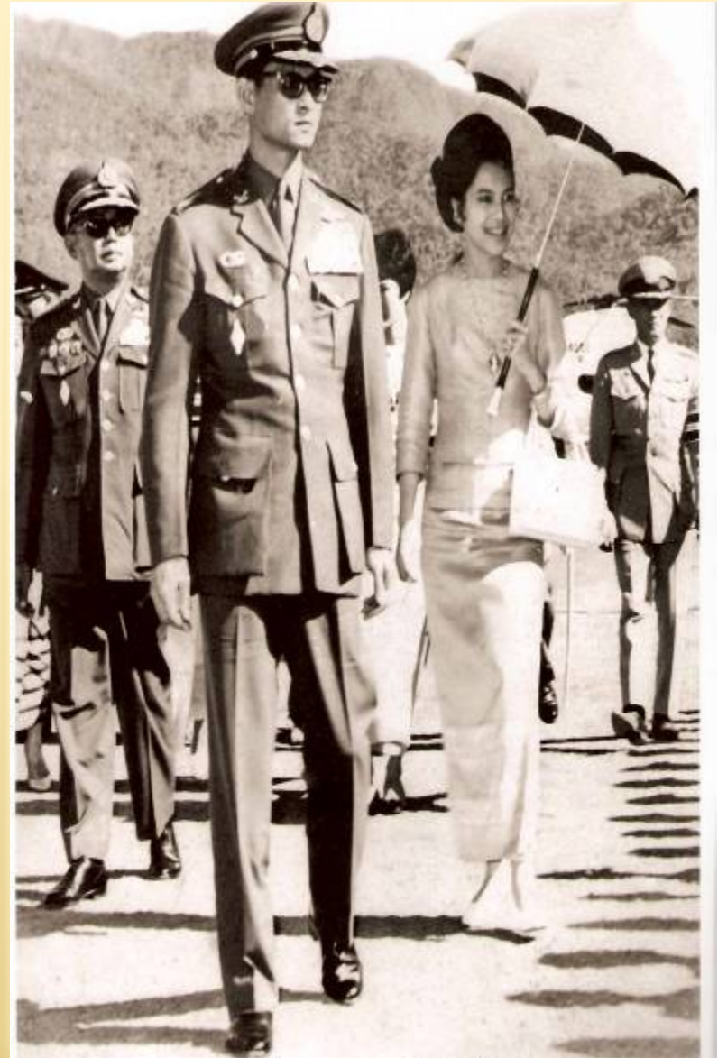
เสด็จพระราชดำเนินทรงเยี่ยมพสกนิกร เมื่อวันที่ ๕ มกราคม ๒๕๑๑ ตามบ้านแม่ฮ่องสอน